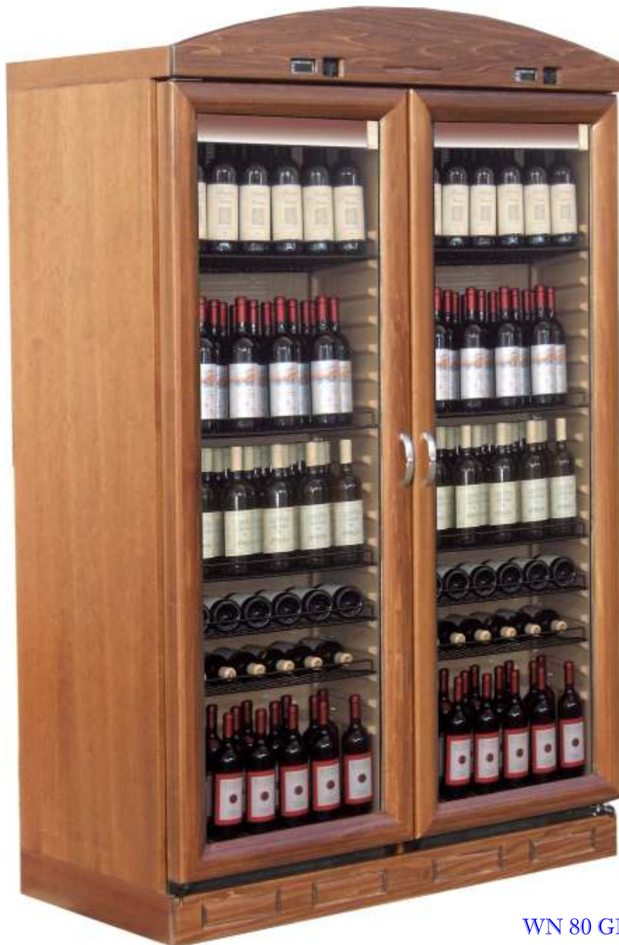
WN 80 GLD